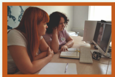
On-line консультация skype: centr-reab