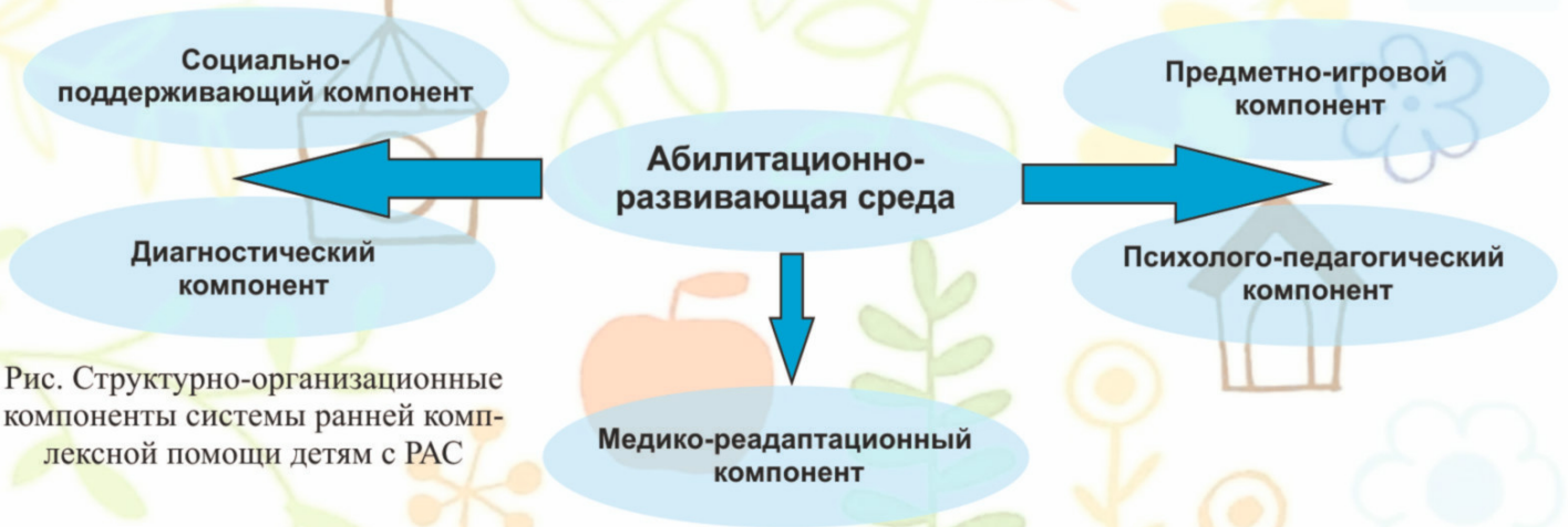
Рис. Структурно-организационные компоненты системы ранней комплексной помощи детям с РАС

Эта пятикомпонентная модель доказала свою эффективность и была отмечена Фондом поддержки детей, находящихся в трудной жизненной ситуации. В результате этого учреждение стало одной из четырех в РФ стажировочных площадок Фонда по проблеме реализации инновационных технологий сопровождения семей, воспитывающих детей с ОВЗ в системе ранней помощи. На базе ресурсного методического центра учреждения был создан Региональный ресурсный центр (РРЦ) по ранней помощи.