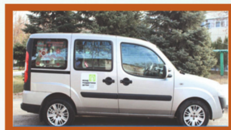
Социальное такси 48-31-77